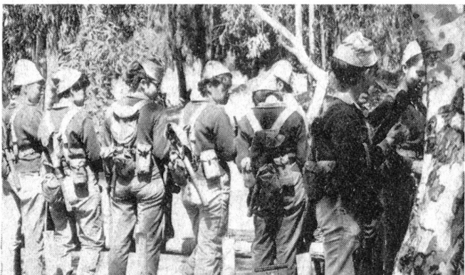
In Israel wissen die uniformierten Mädchen mit Maschinenpistolen und Sturmgewehren genau so gut zu schießen und zu treffen wie ihre männlichen Kameraden.