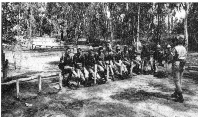
Weibliche Offiziere und Unteroffiziere besorgen auch die Ausbildung der Rekrutinnen an den Waffen.

ZAHAL's Soldatinnen stehen in Israel in großem Ansehen. Ihre überdurchschnittlichen Leistungen haben wesentlich zum raschen und entscheidenden Sieg über die arabischen Armeen beigetragen.