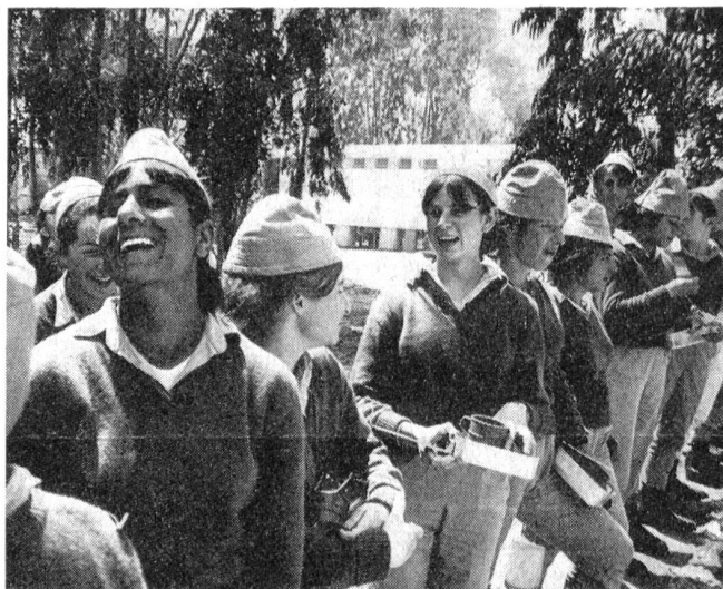
Zum Fassen angetreten. Trotz der Härte des Dienstes ist die Moral der Mädchen hoch und ihr Humor bricht immer wieder durch.