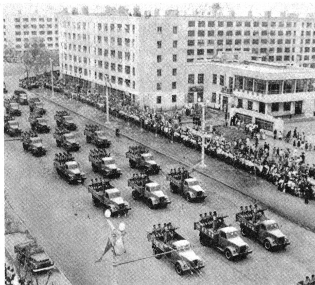
Parade der nordkoreanischen Armee in Pyongyang