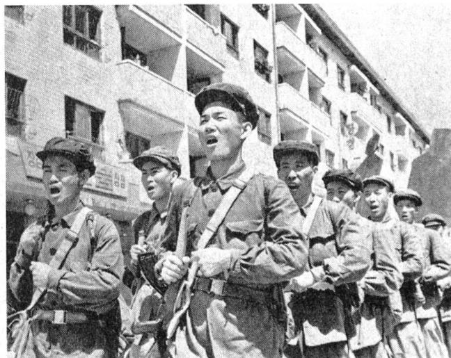
Angehörige nordkoreanischer Milizformationen (Werkschutzeinheiten)