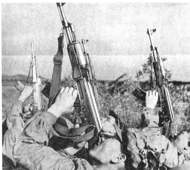
Nordkoreanische Soldaten bei Schießübungen gegen Flugzeuge