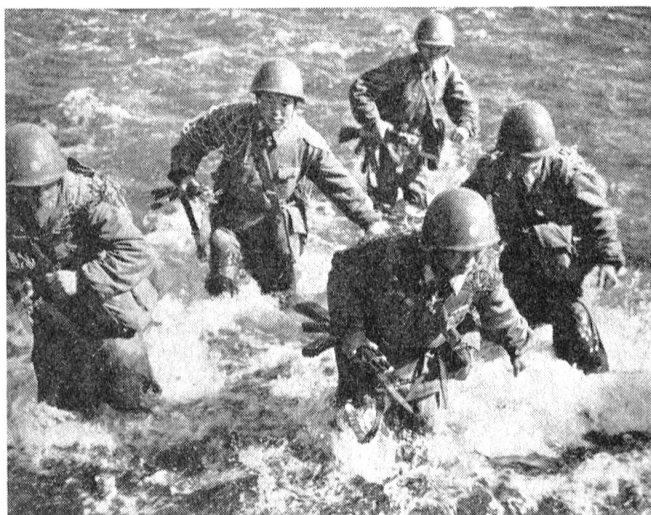
Nordkoreanische Soldaten beim Durchwaten eines Flusses