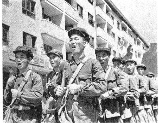
Angehörige nordkoreanischer Milizformationen (Werkschutzeinheiten)