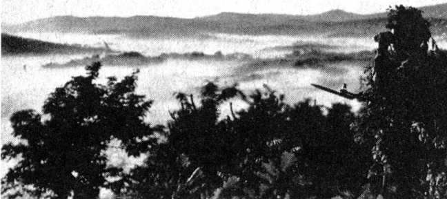
Nordkoreanische Soldaten an der Demarkationslinie