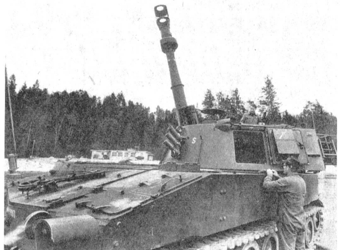
Die Panzerhaubitze M-109, mit welcher die Schlagkraft unserer Armee stark erhöht werden kann. Deutlich sind die groß dimensionierte Mündungsbremse und der Rauchabzug zu erkennen.

Die Panzerhaubitze wurde in den Jahren 1966 und 1967 gründlichen Prüfungen unterzogen und im letzten Jahr in zwei Truppenübungen erprobt. Die erste Erprobung mit Rekruten in Bière zeigte, daß die Grundausbildung in der dafür zur Verfügung stehenden Zeit möglich ist. Für die Umschulung von Artilleristen stellte sich heraus, daß für Kader und Motorfahrer ein längerer Kurs ins Auge gefaßt werden muß.