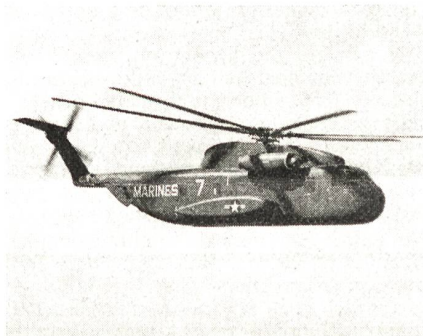
Sikorsky CH-53, der schwere Kampfhubschrauber.

für Serien-Helikopter der westlichen Welt hat Lt Col R. Guay mit einem Sikorsky CH-53 des US Marine-Corps aufgestellt. Der Hubschrauber beförderte bei einem Testflug eine Nutzlast von 12 900 kg. Das Gesamtgewicht der CH-53 erreichte 23 400 kg. Nach Angaben der Piloten wurden Geschwindigkeiten bis 220 km/h erfliegen. Das US Marine-Corps setzt die CH-53 für schwere Truppen- und Materialtransporte, die US Air Force für Rettungs- und Bergungsaufgaben auf dem südvietnamesischen Kriegsschauplatz ein.