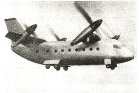
Modell des projektierten deutschen VTOL-Transporters VC 400 in der Transitionsphase.

des deutschen VTOL-Transporters VC 400 macht Fortschritte. Die Vereinigten Flugtechnischen Werke (VFW) gaben bekannt, daß mit der Fertigung von Propellern und Getrieben begonnen wird. Sie werden Teil eines Prüfstandes für Antriebssysteme sein, der vorerst stationär, später jedoch als Schwebegestell flugfähig gemacht wird. Die VC 400 ist eine senkrechtstartende militärische Transportmaschine mit schwenkbaren Flügeln und vier Turbo-prop-Triebwerken. Das Prinzip des Hubschraubers wird bei diesem Flugzeug mit den Vorteilen eines konventionellen Flugzeuges kombiniert, indem die Rotoren auf den Tragflächen schwenkbar angebracht sind. Im Reiseflug soll die VC 400 daher auch Geschwindigkeiten bis 750 km/h erreichen. PHHA