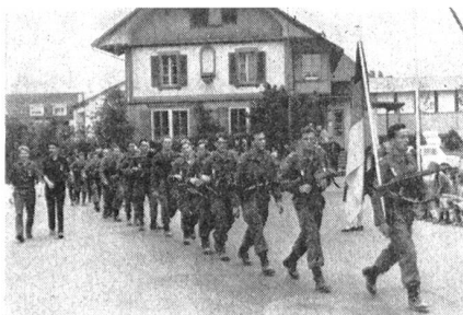
Marschgruppe der deutschen Bundeswehr.