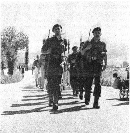
Eine Gruppe der englischen Rheinarmee am Zwei-Tage-Marsch 1967.

Unterwegs die Marschgruppe der Militärischen, die letztes Jahr die Schweiz am Sagamarsch, dem Zwei-Tage-Marsch der norwegischen Heimwehren im Raume über Trondheim, vertrat. Ein Bild, das in schönster Weise die Atmosphäre dieser Marschprüfung zeigt.