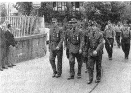
Marschgruppe der Polizei aus Luxemburg und der Stadtpolizei Freiburg im Breisgau.