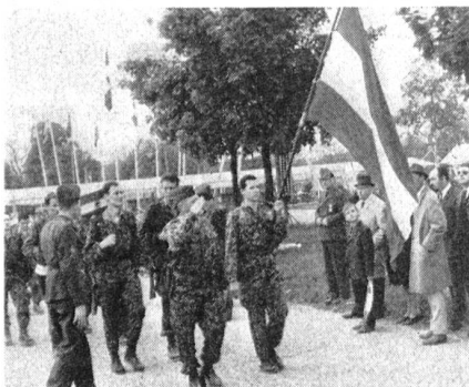
Gern gesehene Gäste sind seit Jahren die Marschgruppen des österreichischen Bundesheeres.

Der Anmeldeschluß für den 9. Schweizerischen Zwei-Tage-Marsch wurde auf den 18. April 1968 (Poststempel auf Einzahlungsschein) festgesetzt. Wir möchten alle Interessenten schon heute daran erinnern, kommt es doch immer wieder vor, daß infolge Nichteinhaltens dieses Termins viele Gruppen abgewiesen werden müssen. Auskunft erteilt zur Bürozeit das Sekretariat des OK in Bern, Telephon (031) 25 78 68, oder Postfach 88, 3000 Bern 7 , wo auch alle weiteren Unterlagen und Reglemente bezogen werden können.