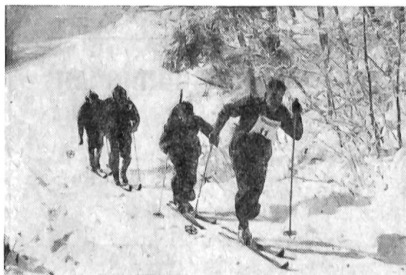
Eine Patrouille im Aufstieg