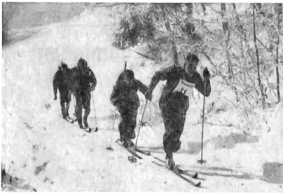
Eine Patrouille im Aufstieg