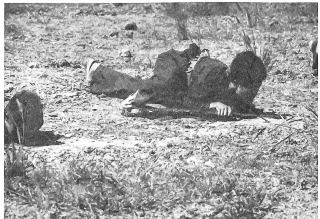
2 Anschleichenübung der Knaben-Truppe.