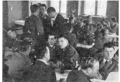
Nun gilt es, die Resultate vom Wettkampf zu besprechen.