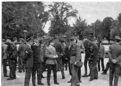
Ankunft der deutschen Kameraden in Schaffhausen

Anschließend an diese Konkurrenz gelangten die Filme «Einer von Allen» sowie «Defilee in Dübendorf» zur Aufführung. Mit letzterem wurde beabsichtigt, den deutschen Gästen einen Querschnitt über die Bewaffnung unserer Armee zu vermitteln.