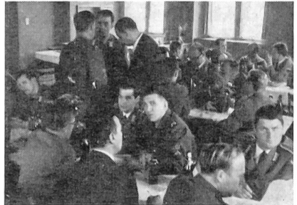
Nun gilt es, die Resultate vom Wettkampf zu besprechen.