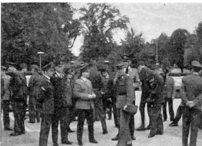
Ankunft der deutschen Kameraden in Schaffhausen

Anschließend an diese Konkurrenz gelangten die Filme «Einer von Allen» sowie «Defilee in Dübendorf» zur Aufführung. Mit letzterem wurde beabsichtigt, den deutschen Gästen einen Querschnitt über die Bewaffnung unserer Armee zu vermitteln.