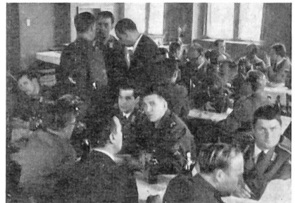
Nun gilt es, die Resultate vom Wettkampf zu besprechen.