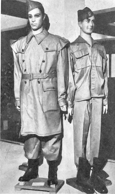
Legionäre Links: Ausgangstenu mit Mantel Rechts: Arbeitstenu