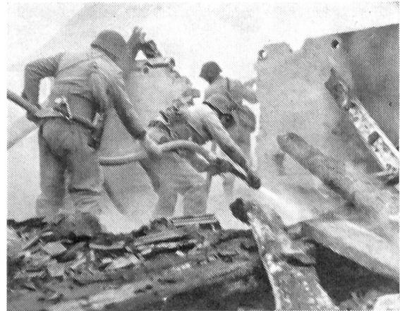
Kriegsfuerwehr im Einsatz

Der Hauptunterschied in der materiellen Ausrüstung besteht darin, daß der Zivilschutz im Gegensatz zur Armee vollständig unbewaffnet ist. Dagegen besitzt der Zivilschutz einen ansehnlichen Bestand an technischen Ausrüstungen aller Art. Erwähnt seien hier lediglich die Anlagen des Alarm- und Uebermittlungsdienstes, der Gerätschaften der Kriegsfuerwehr, des technischen und des Sanitätsdienstes. Wie die Armee besitzt auch der Zivilschutz Ausrüstungen für Atom- und Chemie-Spürpatrouillen sowie Entgiftungsmittel. Die Beschaffung des Materials erfolgt wie für die Armee zentral durch den Bund, der es über die Kantone an die Gemeinden als Hauptträger des Zivilschutzes weiterleitet. Der Bund übernimmt durchschnittlich 60 % der Kosten, Kantone und Gemeinden übernehmen die restlichen 40 % in der Regel je zur Hälfte.