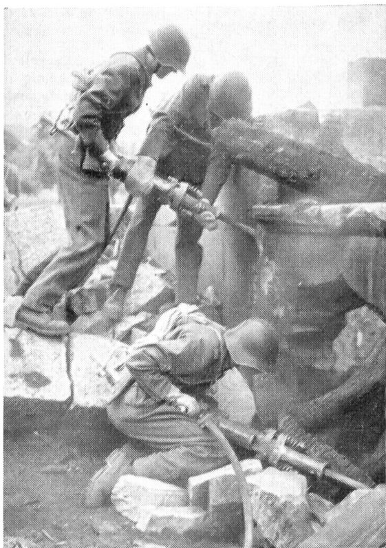
Luftschutztruppen im Einsatz

Diese Gegebenheiten verlangen von jedem Wehrmann außerordentliche Leistungen, vornehmlich auf dem Gebiete des Geistigen und des Seelischen. Die Belastung der Nerven unter einem Beschuß mit Massenvernichtungsmitteln erheischt eine ungewöhnliche innere Widerstandskraft und einen ausgeprägten Widerstandswillen. Dabei wird der Soldat auf dem Schlachtfeld immer einsamer, und die Bekämpfung der Angst wird zum Problem.