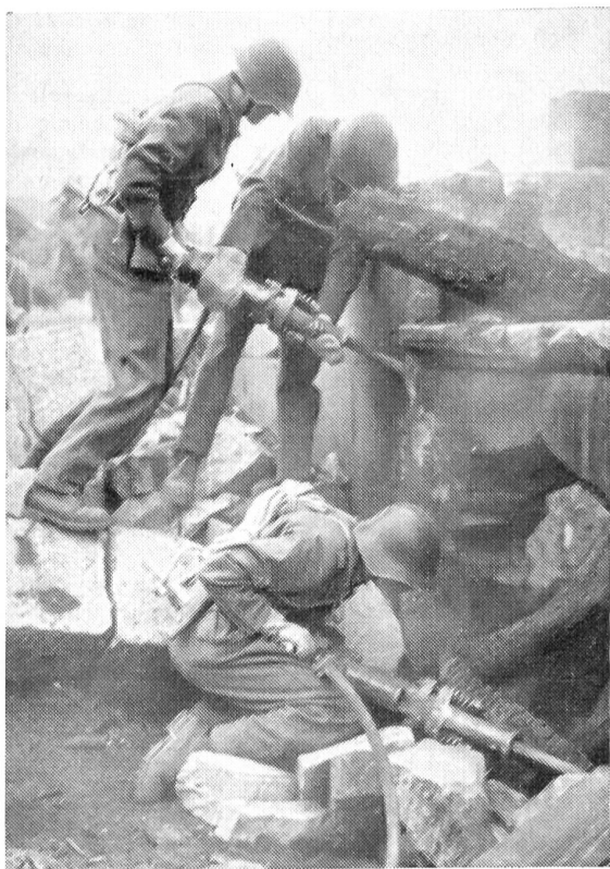
Luftschutztruppen im Einsatz

Diese Gegebenheiten verlangen von jedem Wehrmann außerordentliche Leistungen, vornehmlich auf dem Gebiete des Geistigen und des Seelischen. Die Belastung der Nerven unter einem Beschuß mit Massenvernichtungsmitteln erheischt eine ungewöhnliche innere Widerstandskraft und einen ausgeprägten Widerstandswillen. Dabei wird der Soldat auf dem Schlachtfeld immer einsamer, und die Bekämpfung der Angst wird zum Problem.