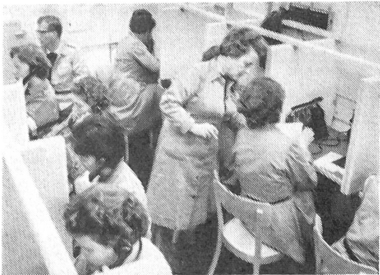
Alarm-, Beobachtungs- und Verbindungsdienst

Die Kommandoordnung der Armee in Friedenszeiten besteht bekanntlich aus folgenden Stufen: