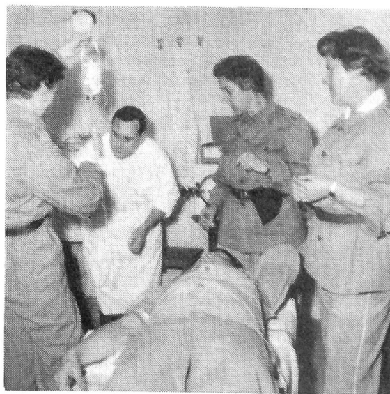
Frauen im Sanitätsdienst

Die Hauswehren und Betriebsschutzorganisationen werden auch Selbstschutzorganisationen genannt. So wird eine