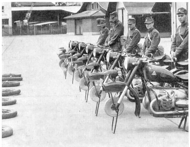
Technische Ausbildung, Ausbau der Vorderachse A-580