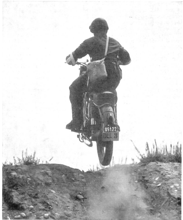
Geländefahren, Motorrad A-580