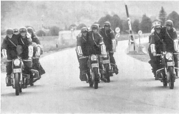
Geschicklichkeitsübungen mit Platzwechsel (Fahrer und Mitfahrer)