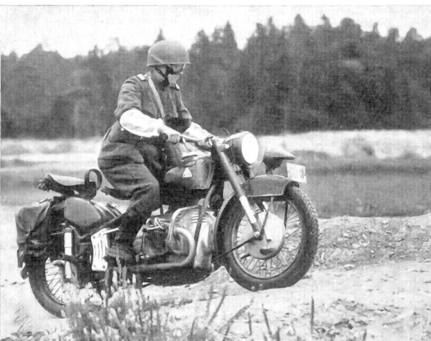
Geländefahren mit Motorrad A-250