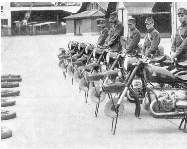
Technische Ausbildung, Ausbau der Vorderachse A-580