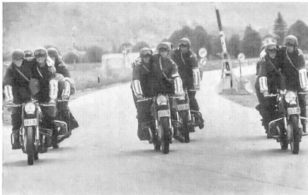
Geschicklichkeitsübungen mit Platzwechsel (Fahrer und Mitfahrer)