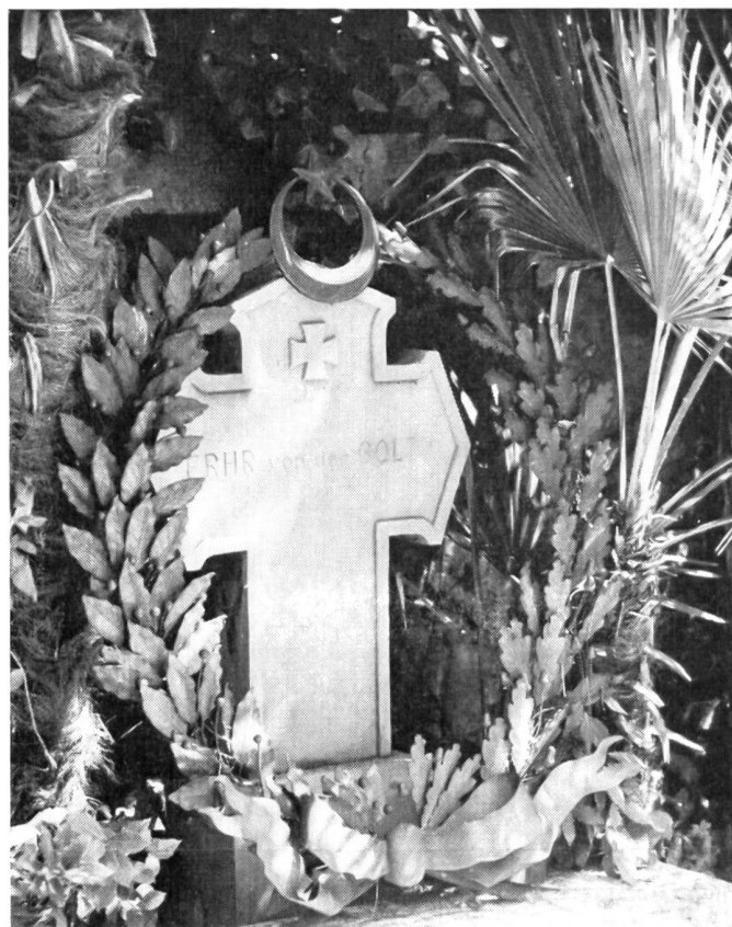
An mehreren Stellen an den Ufern des Bosphorus liegen deutsche Soldatengräber.