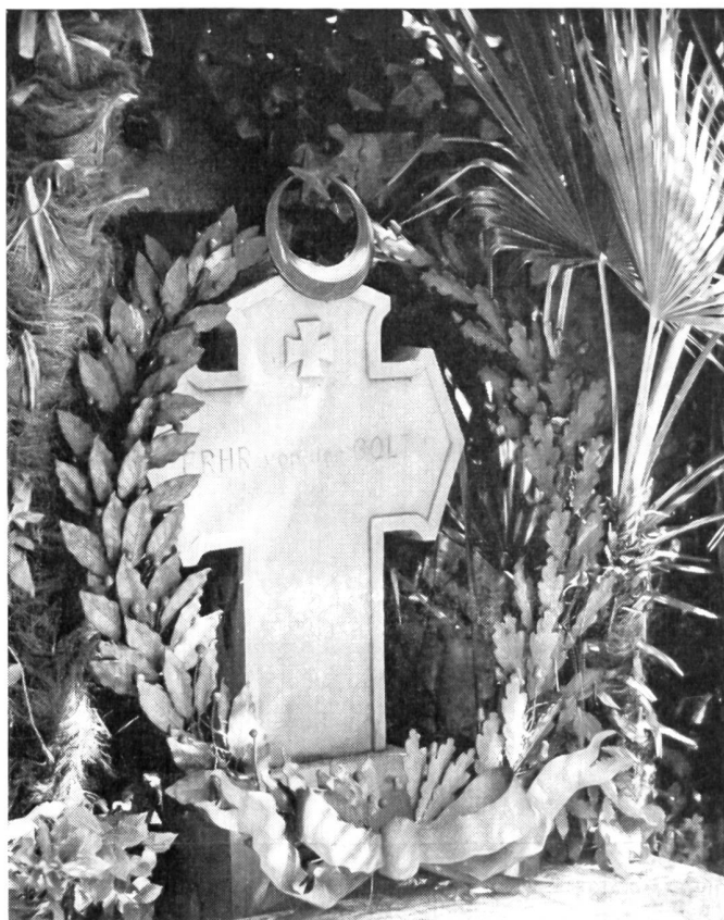
An mehreren Stellen an den Ufern des Bosphorus liegen deutsche Soldatengräber.