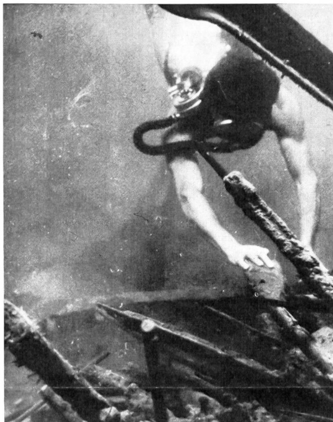
Gewehre, die nicht zum Einsatz kamen! Viele versenkte Munitionsschiffe liegen auf dem Grund der Dardanellen.