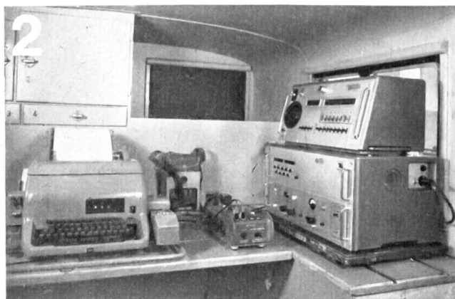
Zellweger AG., Uster/ZH Apparate- und Maschinenfabriken Uster