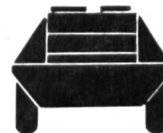
SCHÜTZENPANZERWAGEN M 82 (Schwimmfähig)