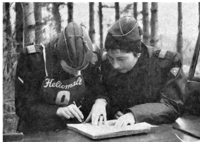
Die Vielseitigkeitskonkurrenz bereitet den beiden Fahrerinnen etwelches Kopfzerbrechen.