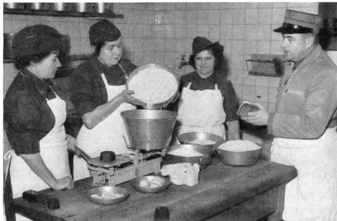
Im Kurs für angehende Chefköchinnen in Thun wird nach Reglement abgewogen und gekocht. Der Instr. Adj. Uof. verfolgt die Arbeit mit kritischem Blick.

Im Einführungskurs wird die FHD in die Geheimnisse der Truppenordnung weitgehend eingeführt; daneben muß sie selbstverständlich auch die Abkürzungen und Signaturen beherrschen lernen und wird am Fernschreiber ausgebildet. Später wird dann die FHD des administrativen Dienstes mit ihrer Einteilungseinheit nicht nur wäh-