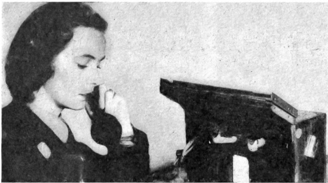
... und übermitteln erhaltene Befehle freundlich.