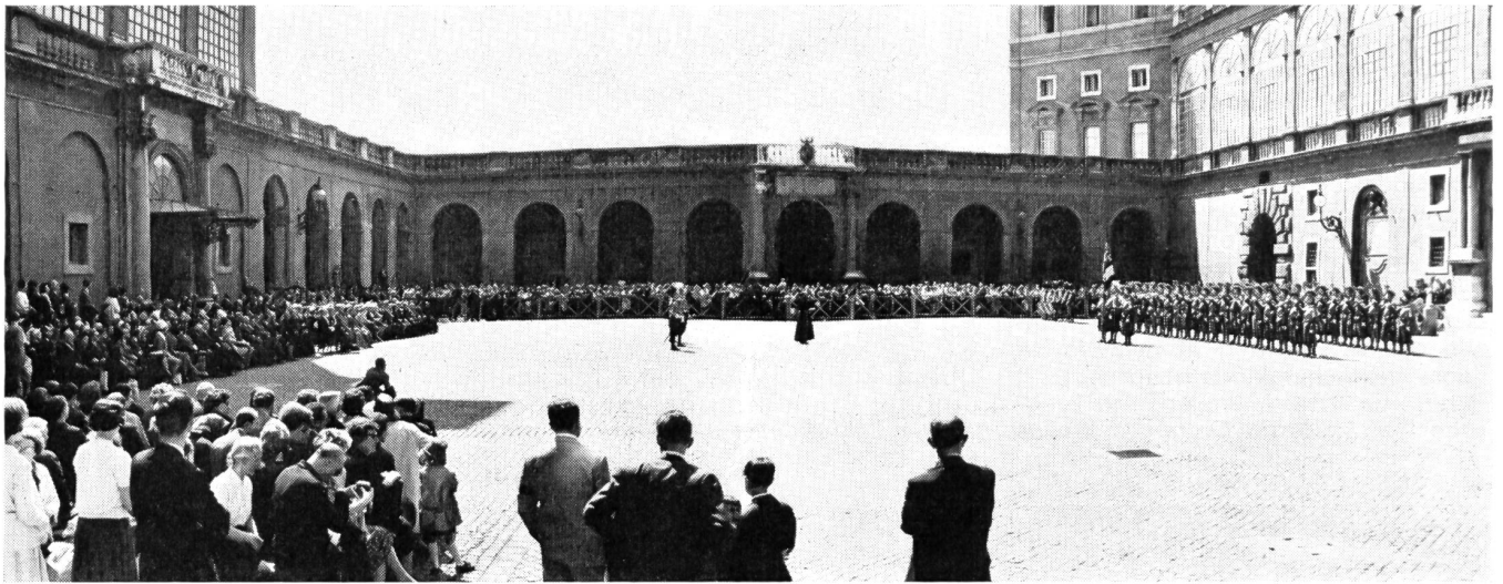
Am 6. Mai jedes Jahr wird in Erinnerung an das Blutopfer der päpstlichen Schweizergarde beim Sacco di Roma der Gardefeiertag festlich begangen, um zu Beginn im Damasushof feierlich die Rekruten zu vereidigen. Dazu ist vor vielen Zuschauern die Schweizergarde mit Fahne angetreten.

allgemein anerkannten modernen Grundsätzen entsprechen. In die Garde aufgenommen werden nur gut-beleumdete, katholische Schweizerbürger im Alter von 19 bis 25 Jahren, welche in der Heimat ihre Rekrutenschule absolviert haben und den physischen Anforderungen genügen. Der Gardist muß ledig sein und eine Mindestgröße von 174 cm haben.