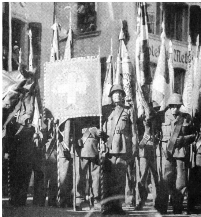
Bei der Begrüßung der Zentralfahne auf dem Thuner Rathausplatz war auch das Banner der Veteranenvereinigung des SUOV mit dabei, stolz präsentiert von einem jung gebliebenen Fähnrich.