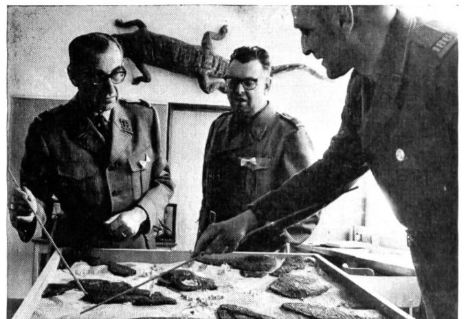
Jetzt gilt es ernst! Die beiden Kampfrichter schildern die weiteren Feindbewegungen und werten die Reaktion des Wettkämpfers.