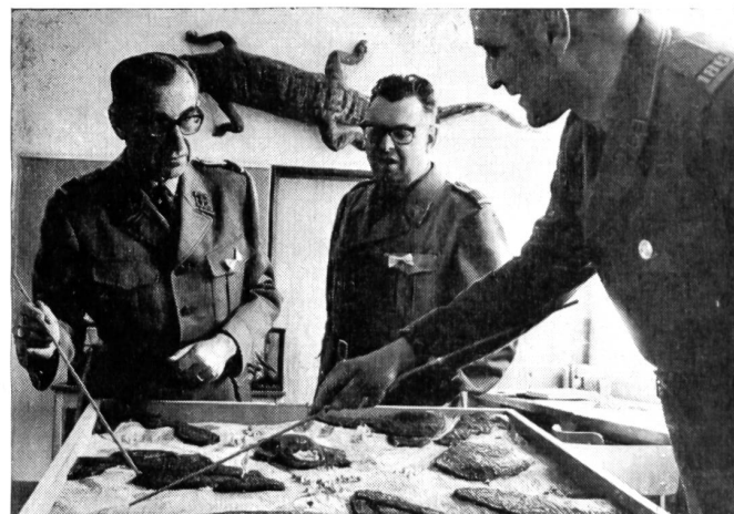
Jetzt gilt es ernst! Die beiden Kampfrichter schildern die weiteren Feindbewegungen und werten die Reaktion des Wettkämpfers.