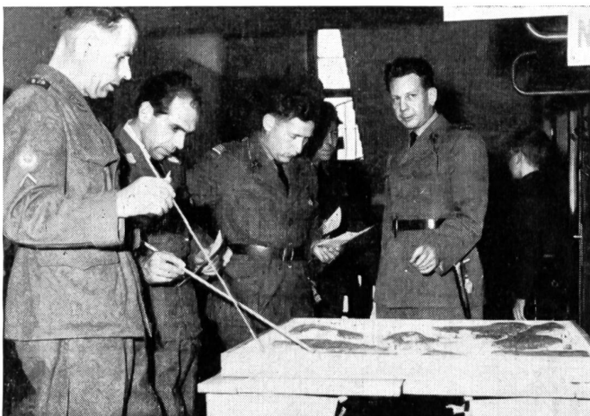
An einem Orientierungssandkasten erhielten die Wettkämpfer Gelegenheit, sich in ihre Aufgabe hineinzudenken.

Der Konkurrent erhielt auf dem Aufgabenbüro 15 Minuten vor Beginn der Prüfung in einem verschlossenen Umschlag, auf welchem die Sandkasten- und die Aufgabennummer waren, die Ausgangslage und den ersten Auftrag. Er begab sich hierauf zum Orientierungs-Sandkasten, wo er den Umschlag öffnete und rund 10 Minuten Zeit hatte, um sich das Gelände einzuprägen und die allgemeine Lage sowie