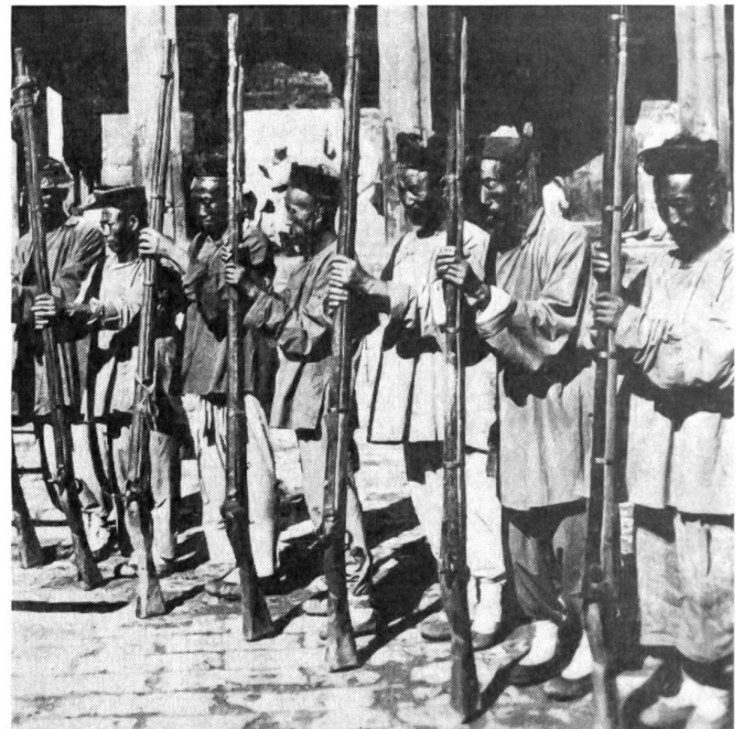
Chinesische Soldaten mit ihren über zwei Meter langen mittelalterlichen Vorderladerflinten, mit denen sie gegen die modern bewaffneten Angreifer kaum etwas ausrichten konnten. «Nicht die ‚bessern Nerven‘ haben in diesem Fall den Kolonialkrieg entschieden, sondern die überragende Technik der Europäer», schrieb später ein hoher deutscher Offizier in seinen Memoiren.