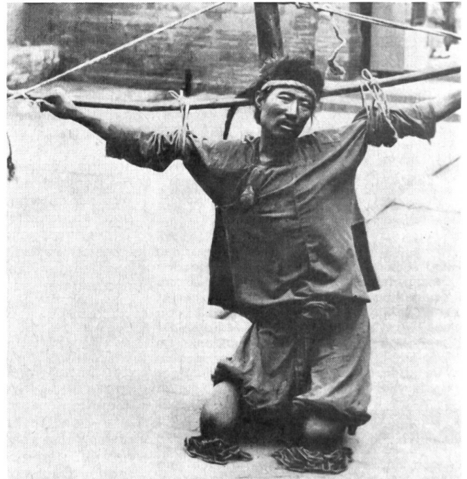
Vor der Hinrichtung wurden die Führer des Boxeraufstandes nach mittelalterlichen Methoden auf qualvolle Art gemartert und öffentlich zur Schau gestellt.