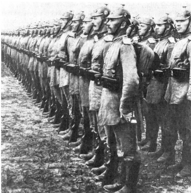
Deutsche Truppen des Expeditionskorps beim Morgenappell vor dem Ausrücken zum Gefecht gegen die Chinesen. Gut genährt, tadellos uniformiert, in der berühmten Disziplin gedrillt, Gewehr rechts bei Fuß, linker Mittelfinger straff an der Hosennaht – wie eh und je die preußische Etikette es so verlangte.