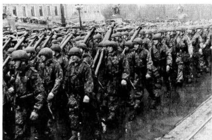
Vorbeimarsch der Grenzschutzkompanie Leonfelden des österreichischen Bundesheeres anlässlich der großen Parade in Wien.

Das militärische Geheimnis gehört zu jenen Grundlagen der Tätigkeit in jeder Armee, über deren Notwendigkeit Einigkeit und über deren Tragweite rein gefühlsmäßige Klarheit besteht, für den es jedoch gar nicht so einfach ist, eine abschließende Begriffsumschreibung zu geben. Wenn sich auch unser Militärstrafgesetz (MStG) sehr eingehend mit dem Tatbestand der militärischen Geheimnisverletzung befassen muß, unterläßt es doch das Gesetz, hierfür eine vollständige Legaldefinition zu geben. Art. 86 des MStG — derselbe Wortlaut befindet sich auch in Art. 106 — spricht ganz allgemein vom Ausspähen und der Preisgabe an Dritte von «Tatsachen, Vorkehren, Verfahren oder Gegenständen, die mit Rücksicht auf die Landesverteidigung geheim gehalten werden». Welches jedoch im einzelnen diese «Tatsachen, Vorkehren, Verfahren oder Gegenstände» sind, von denen im Interesse der Landesverteidigung das Geheimnis gewahrt werden muß, kann das Gesetz nicht sagen; es muß dies den Bestimmun-