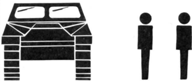
KETTENSCHWIMMWAGEN GAS 47