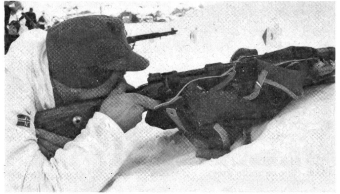
2 Es ist jeweils von besonderem Interesse, die Waffen und die Haltung der einzelnen Ländermannschaften auf dem Schießplatz zu beobachten und zu studieren. Dieses Bild zeigt einen Mann aus der Patrouille der norwegischen Heimwehren.