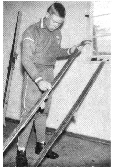
7 Mitentscheidend für den Erfolg ist auch der richtige Griff in die Wachskiste. Die verschiedenen Schichten werden sorgfältig aufgetragen, wobei die Laufsohle zuletzt am frühen Morgen genau nach der Beschaffenheit der Loipe präpariert wird, mit Rücksicht auf die Schneebeschaffenheit, die Aufstiege und Abfahrten.