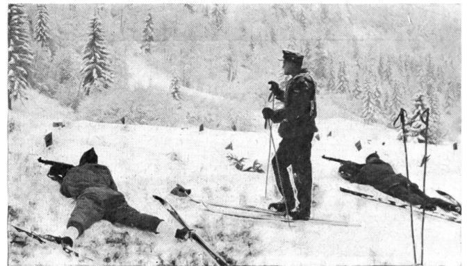
4 Schießtraining der Mannschaft der Bundeswehr 1962 in Garmisch-Partenkirchen.