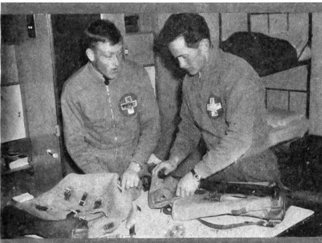
8 Die Packung muß gut anliegen, muß im Gewicht dem Reglement entsprechen und gleichzeitig eine gute Auflage für die Waffe bilden. Zwei Patrouilleure der Schweizer Delegation anlässlich der Internationalen Militär-Skiwettkämpfe 1962 in Garmisch-Patenkirchen.