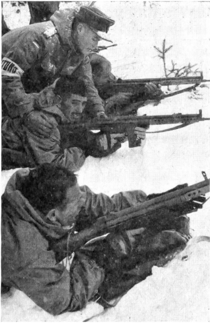
5 Die Skisoldaten einer marokkanischen Militär-Skipatrouille beim Schießtraining.