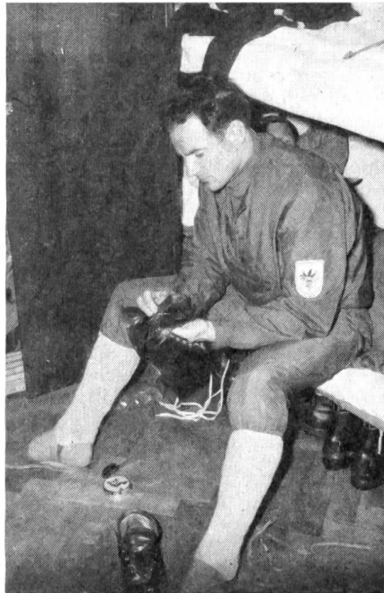
6 Zum Erfolg im Patrouillenlauf muß nicht nur jeder einzelne Mann beitragen, selbst Kleinigkeiten spielen eine Rolle. Der Schuhpflege, wie sie hier dieser österreichische Skisoldat betreibt, kann entscheidende Bedeutung zukommen, kann doch ein drückender Schuh unterwegs Sekunden ausmachen.