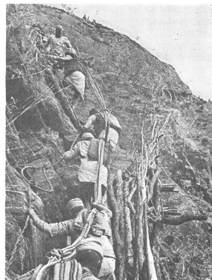
Praktische Hilfe in Nepal. Seiltransport zur Marsyandi-Brücke. Es waren 150 Träger, die das 110 m lange und 800 kg schwere Seil über diese steil abfallende Wand zur Baustelle schleppten, wo die Männer der SHAG mithalfen, eine lebenswichtige Brückenverbindung zu bauen. Auch hier ging es darum, Hilfe zur Selbsthilfe zu gewähren, materiell und beratend die gute Partnerschaft zu verwirklichen.

Mit Geld allein kann keine wirksame Hilfe gebracht werden. Es wurden mit dieser an sich bequemen Hilfe sehr schlechte Erfahrungen gemacht; das Geld versickerte in vielen Kanälen und im Sande, es wurde verschleudert oder zum persönlichen Aufwand eines jungen, wenig Erfahrung aufweisenden Regierungsapparates vertan. Als wirkungsvollste Hilfe hat sich jene erwiesen, wo sich junge Menschen, Fachleute verschiedenster Gebiete, dafür zur Verfügung stellten, in jenen Ländern selbst zu wirken und den sinnvollen Einsatz der dafür aufgebrauchten Geldmittel zu leiten und zu überwachen. Wert- und wirkungsvoll ist auch die Hilfe, die dadurch gebracht wird, daß besonders ausgewählte junge Angehörige der Entwicklungsländer bei uns administrativ und beruflich geschult werden, um dann unter weiterdauernder Betreuung in ihren Ländern selbst mitzuhelfen, die bestehenden Probleme zu lösen. In der Schweiz ist es das «Schweizerische Hilfswerk für außereuropäische Gebiete» (SHAG), das in dieser Richtung arbeitet, mit großer Geduld Stein auf Stein legt und auch beachtliche Erfolge zu verzeichnen hat. Wie wäre es, wenn sich möglichst viele junge