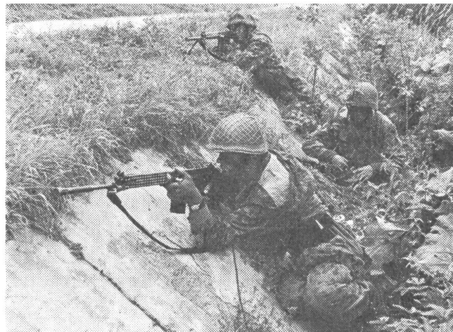
Infanterist mit Sturmgewehr

Wenn also mit 1. Januar 1963 die neue Gliederung in Kraft getreten ist, ist dies, wie uns versichert wurde, nur ein neuer Schritt zur Erhöhung der Schlagkraft des Bundes-