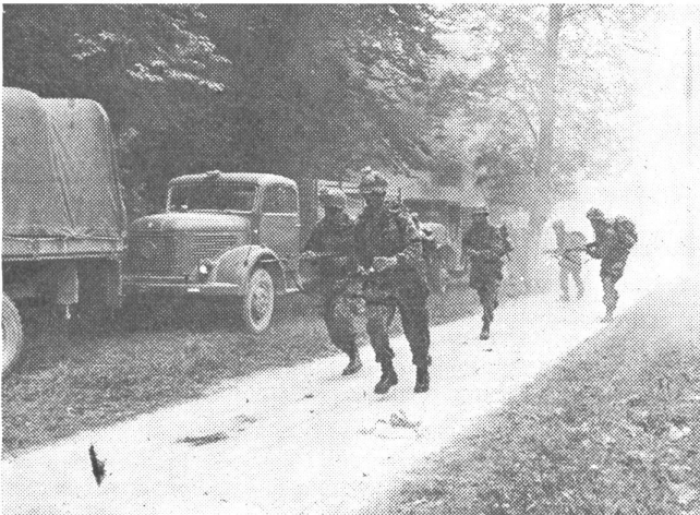
Kampfgruppe greift stehende Transportkolonne an

andere Truppe auch nur annähernd so differenziertes Material zur Verwendung im Kampf hat. Das Wesensmerkmal, der Kampf zu Fuß, blieb bisher trotz Motorisierung erhalten, denn das Element des Infanteristen ist der vordere Kampfschauplatz, und dort kämpft er mit der Waffe, die er selbst führt und bedient.