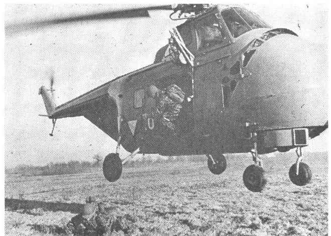
Infanterie-Einsatz vom Helikopter aus