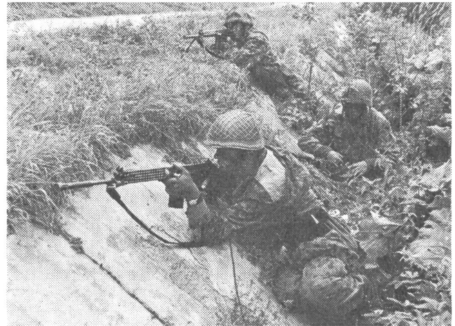
Infanterist mit Sturmgewehr

Wenn also mit 1. Januar 1963 die neue Gliederung in Kraft getreten ist, ist dies, wie uns versichert wurde, nur ein neuer Schritt zur Erhöhung der Schlagkraft des Bundes-