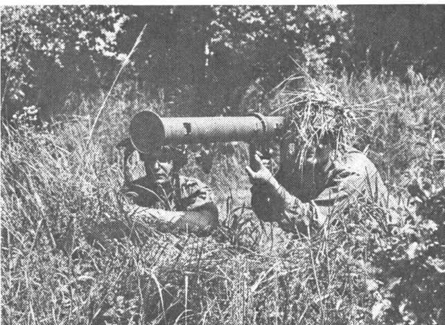
Infanterist mit Panzerabwehrrohr

Wie bei allen Streitkräften anderer Länder ist der Trend zur Vollmotorisierung auch beim österreichischen Bundes-