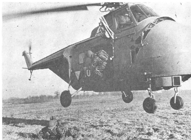
Infanterie-Einsatz vom Helikopter aus