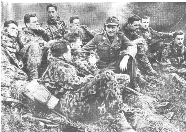
Unteroffizier im Kreise seiner Gruppe

Im Korea-Krieg brachte, wie erinnerlich, die Infanterie und nicht die Panzerwaffe die Entscheidung. Eine reelle Auswertung der Geschichte sowie der jüngsten Vergangenheit kann somit nur zum einzig richtigen Schluß führen: Die Lösung heißt nicht Panzer oder Infanterie, sondern Panzer und Infanterie. Die Infanterie wird also niemals überflüssig werden, sondern eine Neuentwicklung wird die Infanterie dazu anhalten, die für sie richtigen Konsequenzen zu ziehen. Waffenmäßig hat das dazu geführt, daß keine