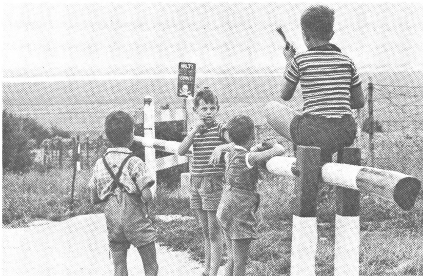
Hier endet die Freie Welt. Eine früher rege benutzte Straße nach Ungarn sperren Schlagbaum und verminte Drahthindernisse. Dahinter stehen alle 500 m die Wachtürme der kommunistischen Wächter.

vereint marschieren, bilden eine Gefahr für die Menschheit. Solange die Versorgung der Länder Afrikas, des Fernen und Mittleren Osten, vor allem Ägyptens und Indonesiens, mit sowjetischen Waffen nicht aufhört und die sogenannte Wirtschaftshilfe des Kommunismus auf politische Ziele ausgerichtet ist, kommen die vielen schwelenden Brennpunkte in der Welt, von denen jeder einzelne einen dritten Weltkrieg auslösen könnte, nicht zur Ruhe. Es ist eine Tragik, erleben zu müssen, wie ein Nehru in Indien, das durch die Rotchinesen akut bedroht ist, den Weg nicht findet, um mit dem benachbarten Pakistan den seit Jahren schwelenden Konflikt um Kaschmir zu begraben, während Pakistan mit Peking freundschaftliche Beziehungen unterhält und den Chinesen im Rahmen eines Luftfahrtabkommens sogar seine Flugplätze öffnet, unbeachtet der Tatsache, daß dieses Land Mitglied der SEATO ist. Das sind Fehlleistungen führender Politiker, die nicht sie allein, sondern wir alle vielleicht einmal teuer zu bezahlen haben.