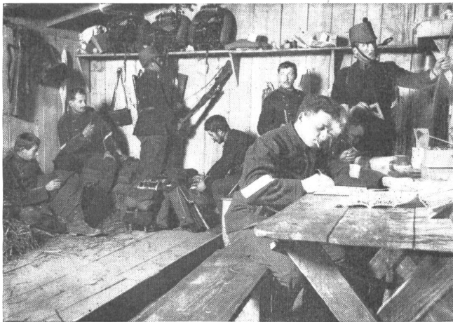
So sahen die Kantonnements in der Grenzbesetzungszeit 1914/18 aus

Diese und unzählige andere Episoden wecken in jedem jungen und älteren Wehrmann Erinnerungen an frohe Stunden im Kreis von Kameraden. Fast scheint es heute selbstverständlich zu sein, daß eine Soldatenstube da ist, wo jeder einzelne seine Stunden der Muße und Ruhe selbst gestalten kann. Ganz anders war die Situation, als 1914 der Erste Weltkrieg ausbrach. Monatlang mußten unsere Soldaten in kleinen Grenzdörfern Aktivdienst leisten. Dorfstuben und Wirtschaften waren überfüllt, und es herrschte ein Mangel an geeigneten Aufenthaltsräumen. Der Sold pro Tag betrug anno dazumal ganze 80 Rappen und ein Lohnausgleich war unbekannt. Mit großer Sorge sah man mancheorts dem kommenden Winter entgegen.