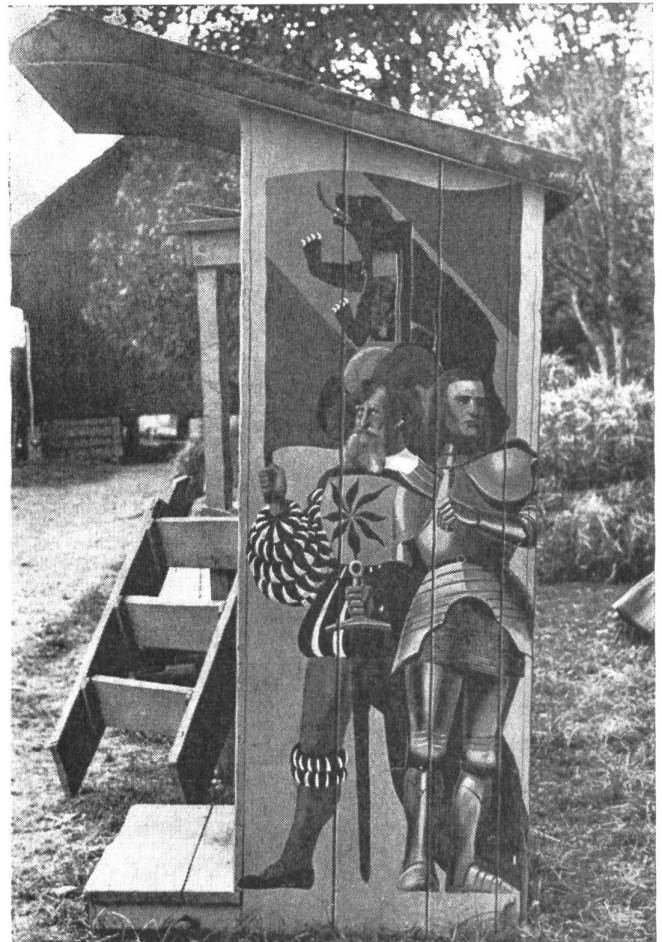
Solch bunt geschmückte Schildwachhäuschen hat die Truppe im Zweiten Weltkrieg vielerorts aufgestellt