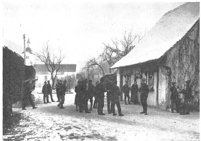
Soyhières — eine der ersten Soldatenstuben, mit denen dem Mangel an geeigneten Aufenthaltsräumen für unsere Soldaten im Ersten Weltkrieg energisch zu Leib gerückt wurde

Während des Ersten Weltkrieges wurden rund tausend Soldatenstuben geführt, im Mai 1917 waren 178 Stuben gleichzeitig in Betrieb, die höchste Zahl, die in einem Monat erreicht wurde. Die Idee, einen angenehmen Aufenthaltsraum zur Verbringung der Freizeit und einen Ort der Begegnung an neutraler Stelle zu schaffen, hatte sich erfolgreich durchgesetzt. Im Zweiten Weltkrieg wurden die