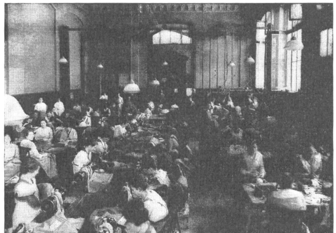
In dieser Uniformenschneiderei, die in einer Basler Turnhalle eingerichtet wurde, haben die Frauen einen wertvollen Beitrag zur Landesverteidigung geleistet

In Zürich wurde eine Vereinigung gegründet, die diesen Mißständen zu Leibe rücken wollte und daran dachte, eine Art von alkoholfreien Wirtschaften einzurichten für die Soldaten. Diese Idee nahm bestimmte Formen an, als es der jungen Journalistin Else Spiller gelang, die Unterstützung des Armeekommandos, des Armeearztes und anderer hoher Offiziere zu gewinnen. Bereits ein paar Tage nach einer ersten Rekognoszierungsfahrt erhielt der Jura die beiden ersten improvisierten Soldatenstuben. Eine Vielzahl von Schwierigkeiten mußte dabei überwunden werden. Wagenremisen, Hühnerställe, Schulstuben und eine alte Kapelle wurden nach und nach als Stuben eingerichtet. Ebenso wichtig wie das Problem der Lokalitäten war die Frage der Leitung. Da die Soldatenstube als Ersatz für die heimatliche Wohnstube gedacht ist, mußte auch noch nach einer «Mutter» Umschau gehalten werden. Junge Frauen und Töchter, die bei den Eltern lebten und keiner Berufsarbeit nachgingen, aber auch andere, die ihre Berufsarbeit spontan aufgaben, konnten für diese Aufgabe gewonnen werden. «Soldatenmutter»,