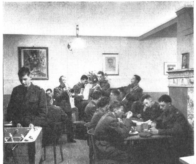
Bei Ausbruch des Zweiten Weltkrieges standen bereits 40 vollständige Einrichtungen für Soldatenstuben versandbereit

Soldatenstuben-Leiterinnen von Anfang an in die Organisation des FHD einbezogen und erhielten damit das Anrecht auf Sold, Unterkunft und Verpflegung. Rund 650 Soldatenstuben konnten in den Jahren 1939/45 eröffnet werden. Außer denjenigen für die eigenen Soldaten wurden auch solche für französische, polnische, italienische, deutsche und russische Internierte eingerichtet.