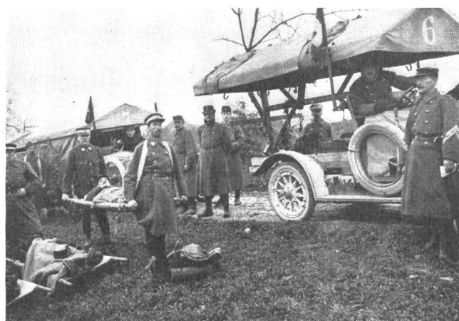
An den Felddienstübungen des Sanitätsdienstes nahmen schon früh die ersten Motorfahrzeuge teil

Aus diesen Ueberlegungen geht hervor, daß die Schweiz wie Oberstkorpskommandant H. Frick einmal sagte, «ihr