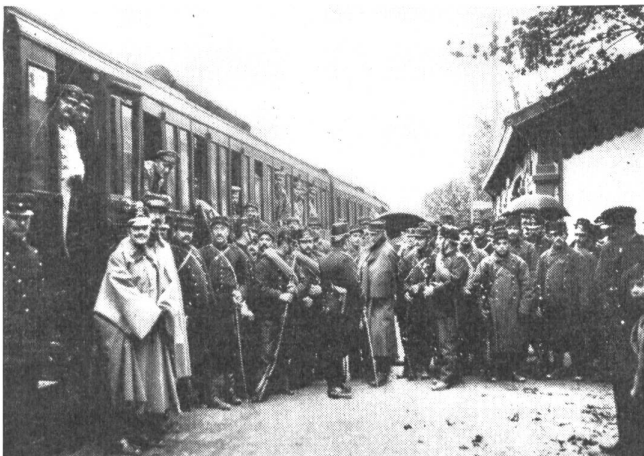
Die soziale Schweiz im Kriegsgeschehen: Ein deutscher Verwundetenzug wird an der schweizerisch-französischen Grenze übernommen

Aus diesen Ueberlegungen geht hervor, daß die Schweiz wie Oberstkorpskommandant H. Frick einmal sagte, «ihr