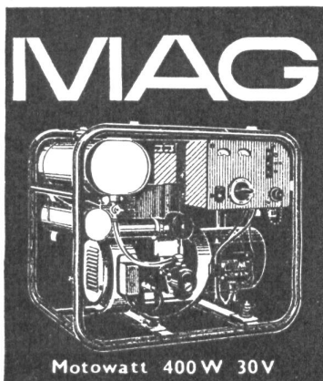
Motowatt 400 W 30 V

BENZIN-MOTOREN 2 und 4-Takt, 1 und 2 Zylinder 2 bis 18 PS