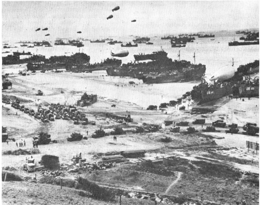
Normandie, 6. Juni 1944.