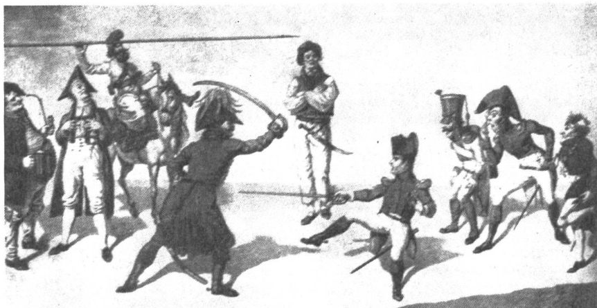
Der Norddeutsche Kosak Blücher Engländer Napoleon Franz. Soldat Bürgerstand Der Süddeutsche Soldatenstand