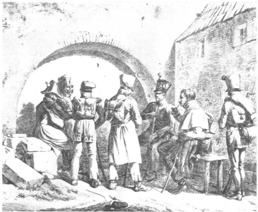
Französische Kriegsgefangene 1814 Stich von Johann Adam Klein (Berliner Kupferstichkabinett)

An dem Tage, an welchem endlich Delfzijl den Holländern zurückgegeben wurden, waren die Schweizer von Coevorden schon lange auf dem Rückmarsch begriffen. Aber fast die Hälfte von jeder Kompanie der Garnison war desertiert und in die in englischen Sold übergegangene russisch-deutsche Legion eingetreten. Am 7. Mai waren die Schweizer aus der Feste Coevorden abgezogen und erreichten am 25. Mai Lille, also französischen Boden. Das Reiseziel war Vincennes, damals Depot des vierten Schweizerregimentes. Auf dem Weg von Chan-