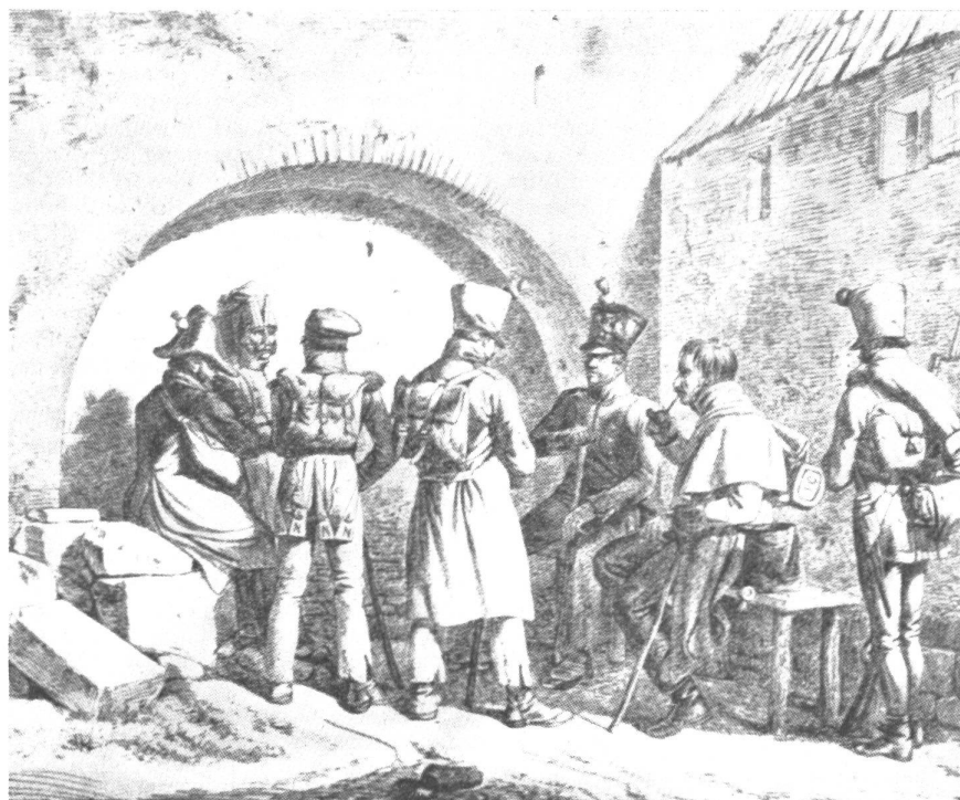
Französische Kriegsgefangene 1814

An dem Tage, an welchem endlich Delfzijl den Holländern zurückgegeben wurden, waren die Schweizer von Coevorden schon lange auf dem Rückmarsch begriffen. Aber fast die Hälfte von jeder Kompanie der Garnison war desertiert und in die in englischen Sold übergegangene russisch-deutsche Legion eingetreten. Am 7. Mai waren die Schweizer aus der Feste Coevorden abgezogen und erreichten am 25. Mai Lille, also französischen Boden. Das Reiseziel war Vincennes, damals Depot des vierten Schweizerregimentes. Auf dem Weg von Chan-