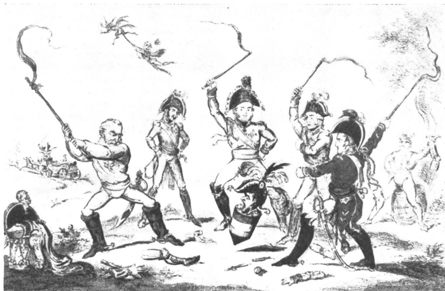
Kaiserin auf der Flucht Blücher Bernadotte Schwarzenberg Woronzoff Wellington Georg III. von England