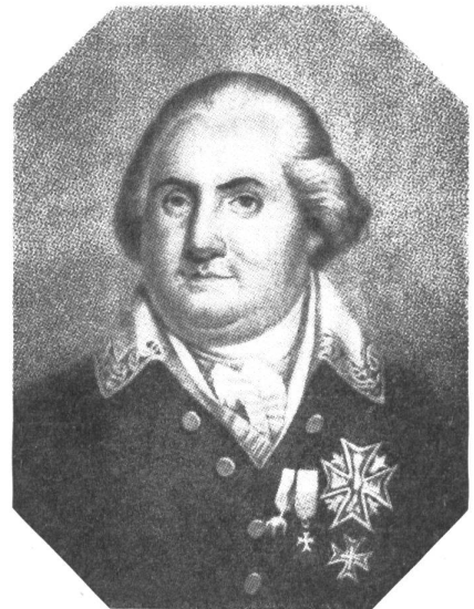
Ludwig XVIII. Stich von Bolt, 1814 (Berliner Kupferstichkabinett)

Es sei hier erwähnt, daß die im russischen Feldzug von 1812 kriegsgefangenen Schweizer namentlich in Nowgorod und Rachangelsk interniert waren und im Sommer 1813 entlassen wurden. Die Gesamtzahl aller Kriegsgefangenen, die auf die Anfang April 1814 vom Zaren Alexander im französischen Senat gegebene Zu-