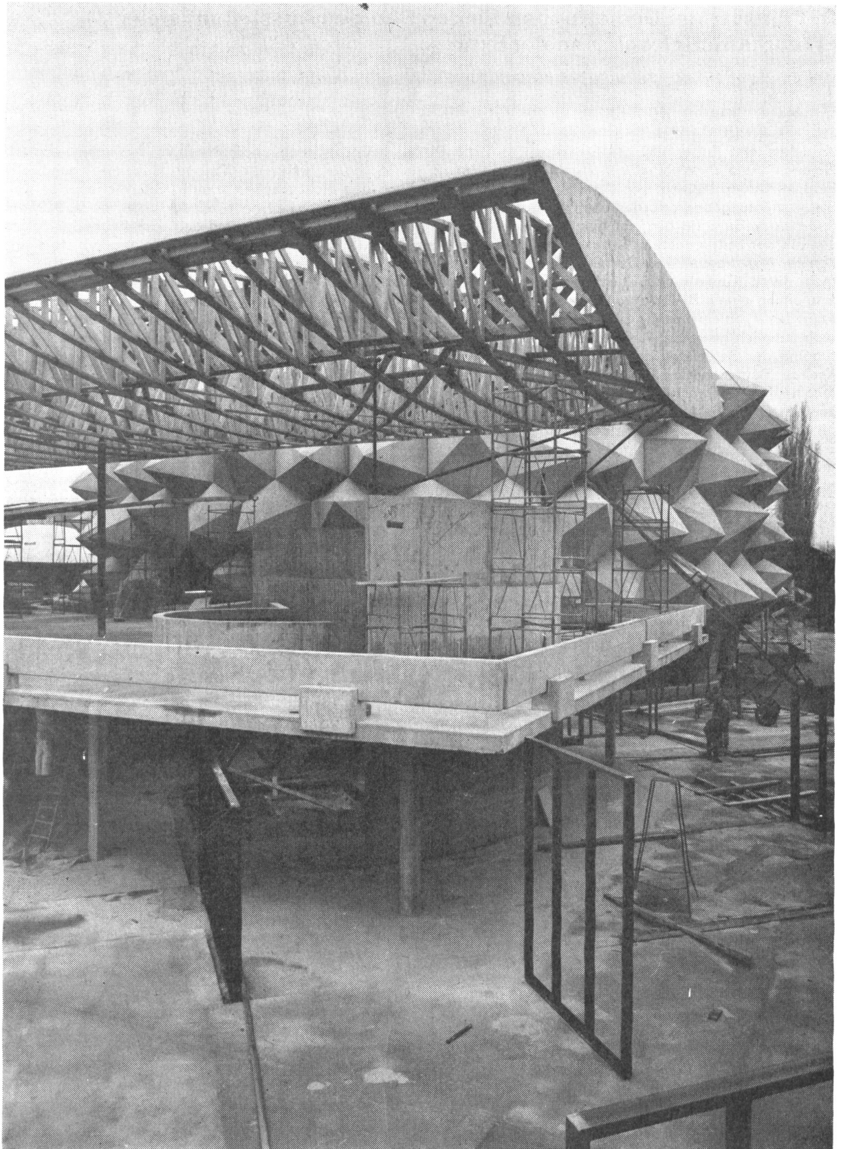
4. Direkt dem Hauptgebäude angeschlossen, befindet sich eine mit grundsätzlich neuen ausstellungstechnischen Methoden gestaltete Ausstellung der modernsten Waffen und Geräte unserer Armee.