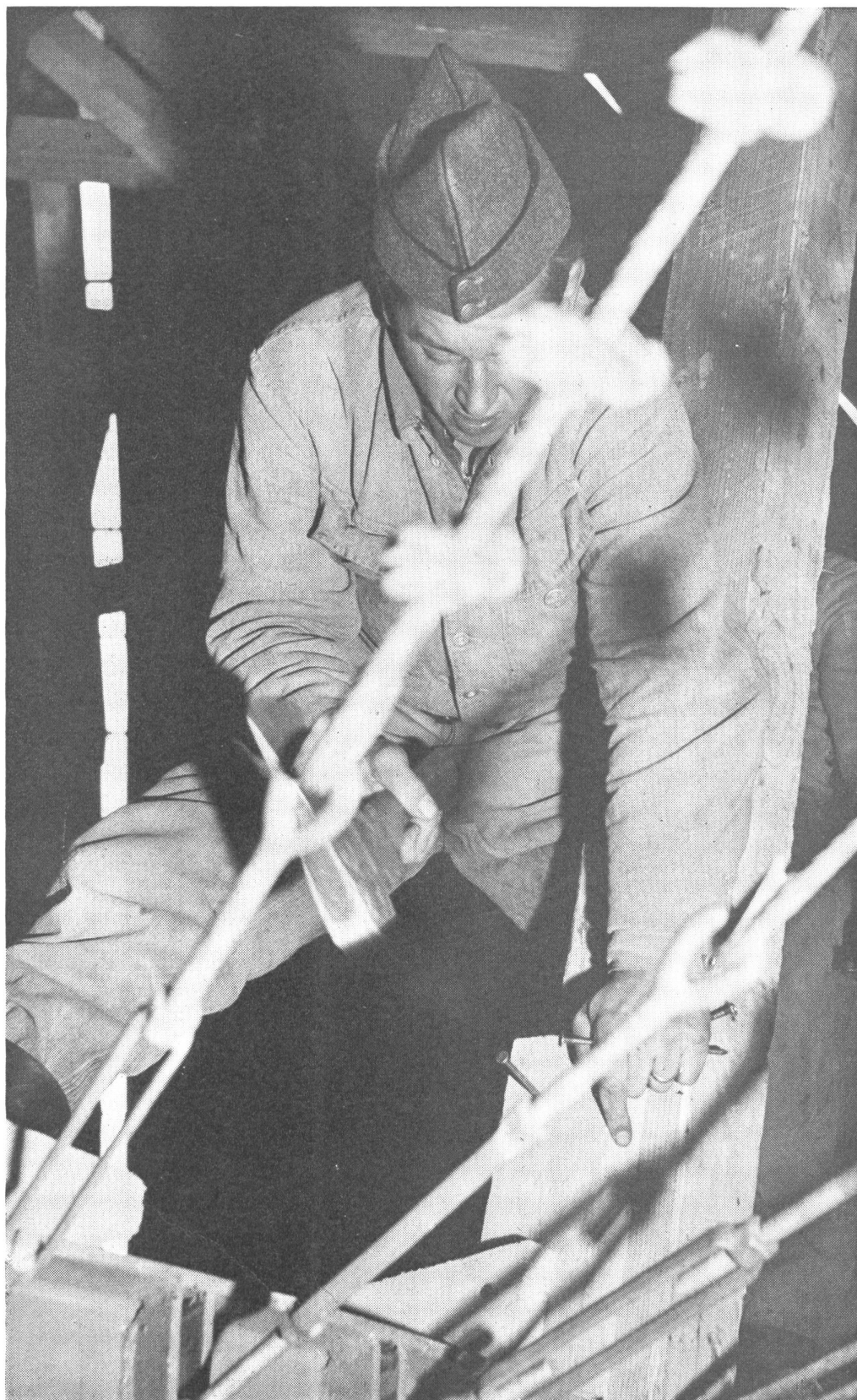
2. Die Armee hat ihre Ausstellung selbst gebaut. 14 Sappeur-Kompagnien leisteten den größten Teil ihres WK 63 auf dem Expo-Gelände in Vidy und brachten die «Wehrhafte Schweiz» ihrem endgültigen Gesicht jeweils ein gutes Stück näher.