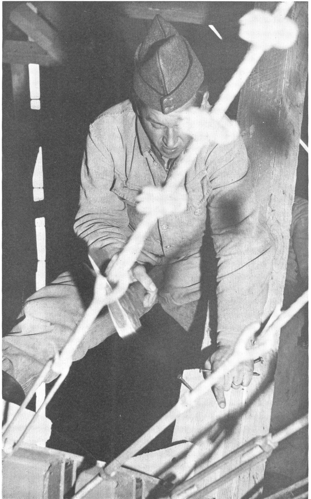
2. Die Armee hat ihre Ausstellung selbst gebaut. 14 Sappeur-Kompagnien leisteten den größten Teil ihres WK 63 auf dem Expo-Gelände in Vidy und brachten die «Wehrhafte Schweiz» ihrem endgültigen Gesicht jeweils ein gutes Stück näher.