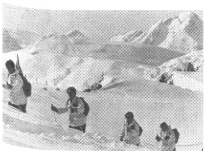
Einen ausgezeichneten Eindruck hinterließen auch die Damen-Patrouillen, wie hier diese Rotkreuz-Pfadi.