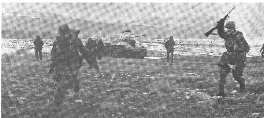
Zusammenarbeit Panzer-Infanterie. Ein Bild von der Ausbildung auf dem großen Truppenübungsplatz des Bundesheeres in Bruck an der Leitha.

Sollte nun der eine oder andere der hier erwähnten Pläne verwirklicht werden, würde Oesterreich nicht nur völlig ungeschützt dastehen, sondern für seine Nachbarn ein gefährliches militärisches Vakuum bilden. Eine solche Entwicklung müßte aber nicht nur die Nachbarn, mehr noch die ganze freie Welt mit Besorgnis erfüllen. Es ist auch verständlich, daß man in der Schweiz diese Entwicklung heute besonders eingehend verfolgt, sich Ge-