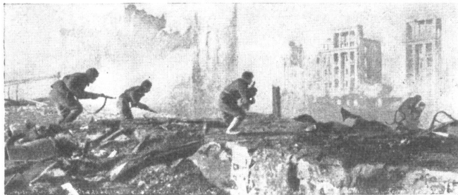
STALINGRAD 1942 Erbitterte Straßenkämpfe in Stalingrad. Sowjetische Infanterie greift an.

Fanfare! Trommelwirbel! Die heisere Stimme des «Führers» Adolf Hitler schreit dem deutschen Volk und der Welt die Schreckensnachricht zu: Der Krieg hat begonnen. Panzer rollen in Feindesland. Der Welt stockt der Atem an jenem unheilswangeren Septembertag 1939. Aber noch ahnt keiner, was in sechs langen Jahren geschehen wird. Noch sind Bombennächte und Winterschlachten, Stalingrad und Monte Cassino, Standgerichte und Partisanen kein Begriff. Bald aber donnern von den Eisbergen des hohen Nordens bis in die Wüsten des schwarzen Kontinents, von den Steppengebieten an der Wolga bis zum Atlantik die Kanonen, bellen Maschinenwaffen, bersten Minen und Sprengladungen. Die Fackel des größten aller Kriege lodert, setzt die Welt in Brand bis an die Küsten des fernen Pazifik. Dieses Werk ist der erste umfassende Bericht über den 2. Weltkrieg. Aus zahlreichen, zum Teil bisher unveröffentlichten Dokumenten und Geheimakten aller am Krieg beteiligten Länder, aus Tagebüchern, Wehrmachtsberichten und Geheimbefehlen erstet die dunkelste Zeit der Geschichte von ihren politischen Hintergründen und Anfängen bis zum bitteren Ende. Über 2500 Bilder zeigen den Krieg an allen Fronten, wie er wirklich war.