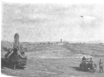
Anlässlich einer Demonstration moderner Waffen vor NATO-Offizieren in Grafenwöhr (Deutschland) kam auch die «Honest-John-Rakete» zum Einsatz. Rechts eine Rakete in der Luft, links eine zweite abschußbereit.