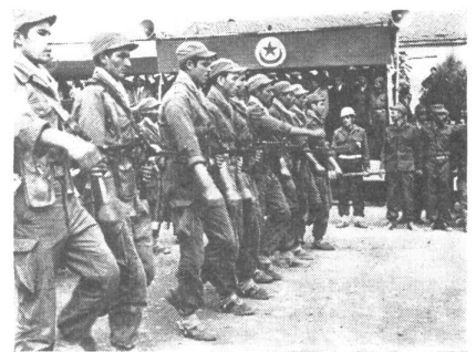
Soldaten der algerischen Armee