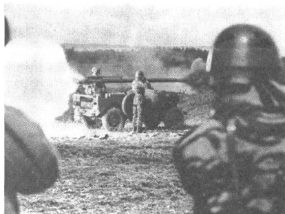
Eine neue französische Panzerabwehr-rakete beim scharfen Schuß

Unser Bild zeigt: Der neue Senkrechtstarter bei der ärodynamischen (normalen, horizontalen) Landung mit ausgefahrenem Bremsschirm.