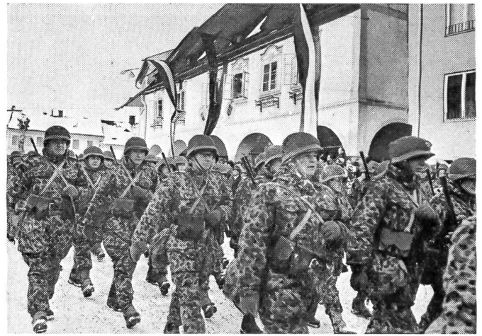
Vorbeimarsch der Grenzschutzsoldaten anlässlich des Grenzschutztages

der Grenze selbst an. Sie vermögen gerade im Stadium der ersten Spannungen die notwendigen Aufgaben einer verschärften Beobachtung und aktiven Ueberwachung der Grenze wahrzunehmen. Treten Grenzverletzungen geringeren Ausmaßes auf, so wird deren Zurückweisung ebenso zu den Aufgaben der Grenzschutztruppen zählen, wie z. B. die Verhinderung von Bandentätigkeit im Grenzgebiet. In Erfüllung dieser Obliegenheiten werden die Einheiten der Grenzschutztruppen automatisch auch die Sicherung der Mobilmachung der Einsatzverbände und der übrigen Einrichtungen des Bundesheeres übernehmen. Im Falle einer echten Aggression besteht die Aufgabe der Grenzschutztruppen darin, das Vorgehen des Aggressors aufzuklären, zu beobachten und im hinhaltenden Kampfe tunlichst bis zum Eintreffen und Eingreifen der mobil gemachten Heereseinheiten zu verzögern.