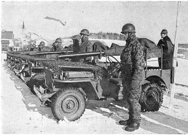
Grenzschutztag in Rohrbach (Mühlviertel, Oberösterreich)