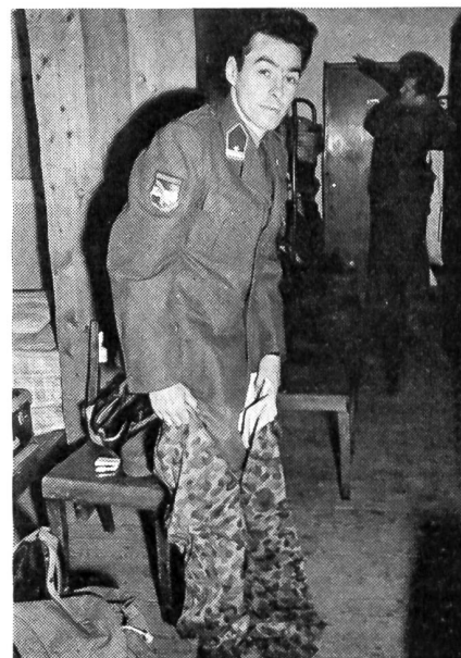
Wachtmeister der Grenzschutztruppe

schutztruppe nicht zu erfüllen, sie verbleibt vielmehr nach wie vor eine Aufgabe der Zollwache und der Exekutivorgane. Die eigentlichen Aufgaben der neuen Grenzschutztruppe liegen auf ganz anderem Gebiet und knüpfen eher an die Tradition der Militärgrenze an. Je geringer der Umfang regulärer Streitkräfte ist, desto größer wird die Gefahr, daß diese bei Beginn einer ersten und bedrohlichen Spannung vorzeitig gebunden werden. Verfügt die militärische Führung über wenig Kräfte, so muß sie trachten, sich zumindest bis zum Beginn entscheidender Kampfhandlungen ihre Handlungsfähigkeit zu bewahren. Dieses Grundgesetz militärischen Handelns, auf österreichische Verhältnisse angewendet, gebietet, die wenigen sofort einsatzbereiten Teile des aktiven Bundesheeres nicht schon bei den ersten Anzeichen oder Auswirkungen einer krisenhaften Lage an einem gefährdeten Grenzabschnitt einzusetzen. Hingegen bietet sich in so einer Situation die Aktivierung örtlich organisierter militärischer Formationen an