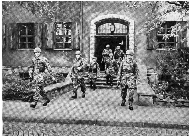
Grenzschutzsoldaten der Kaserne Lendorf bei Klagenfurt (Kärnten)

allerdings noch weiter zurückgehen und müßte dabei zweifellos auch den römischen Limes gebührend berücksichtigen.