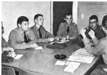
Im ersten Stock findet in einem der drei Zimmer eine Besprechung statt