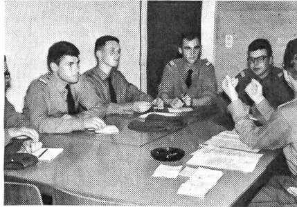
Im ersten Stock findet in einem der drei Zimmer eine Besprechung statt