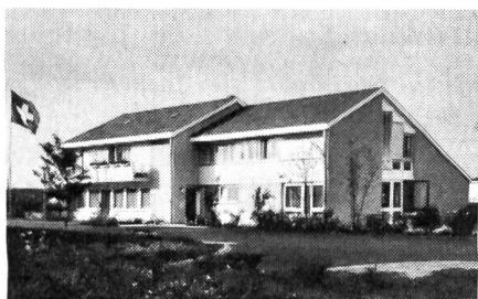
Das einladende Soldatenhaus von Bülach liegt unmittelbar neben der Kaserne

Betritt man das Soldatenhaus von der Kaserne her, so gelangt man durch einen hellen Korridor zum Hauptraum, der sich durch eine Schiebewand in einen kleineren und größeren Raum abtrennen läßt. Die Naturholzdecke zieht sich sichtbar bis zum Giebel empor. Ueber dem Office und dem kleinen Gastzimmer ist eine Galerie mit weiteren Sitzgelegenheiten angeordnet. Von hier gelangt man in die als Mehrzweckräume eingerichteten drei Zimmer, die für stilles Studium, für Gruppenzusammenkünfte, für Besprechungen, für ruhiges Spielen wie geschaffen sind. In der vorderen Gebäudehälfte, durch die der Korridor führt, sehen wir das geräumige Schreib- und Lesezimmer mit einladenden Schreibtischchen und bequemen Sitzgruppen. Zwei Telephonkabinen und zweckmäßig eingerichtete Toiletten befinden sich im Erdgeschoß. Ein großer Sitzplatz besteht im Freien. Im Untergeschoß haben die Soldaten die Möglichkeit, in zwei großen Spielräumen an vier Tischtennisanlagen und einem Tischfußballspiel einen entspannenden Ausgleich zum Dienstbetrieb zu finden. In der vorderen Gebäudehälfte des Obergeschosses befindet sich die Wohnung für die Leitung des Soldatenhauses. Für den Betrieb stehen ferner ein Vorratsraum, ein Büroraum im Erdgeschoß, ausreichende Kellerräume, eine Waschküche und eine Werkstatt zur Verfügung. Das Soldatenhaus Bülach wurde von der bewährten Militärkommission des Christlichen Verein Junger Männer erstellt und wird auch von ihr betrieben.