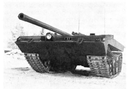
Frontansicht des neuen schwedischen «Kampfwagens S»

In den fünfziger Jahren erreichte die Panzerentwicklung nach schwedischer Ansicht so etwas wie eine Krise. Die taktischen Kernwaffen gaben den gepanzerten Fahrzeugen wieder erhöhte Bedeutung, während gleichzeitig eine gegen früher größere Beweglichkeit verlangt wurde. Das führte zur Forderung nach leichteren Kampfwagen, was vor allem für Schweden mit seinen zahlreichen und tiefen Flüssen vordringlich wurde. Mit den neuen Waffen ist der Gegner in der Lage, die wenigen Brücken rasch zu zerstören, die schwerere Panzer tragen könnten. Die Schweden forderten daher leichtere Panzer, welche die meisten der permanenten Brücken noch passieren können und die mit wenigen Handgriffen in die Lage versetzt werden, selbst Flüsse zu überqueren. Dazu kam noch die Forderung nach verstärkter Waffenwirkung und guter Schutzmöglichkeiten gegen neue Panzerabwehrwaffen wie auch gegen taktische Kernwaffen. Mit den Konstruktionsprinzipien, denen man bei der Panzererzeugung bisher folgte, hätte die Forderung nach vermehrter Waffenwirkung und Schutz nur mit dem Preis eines noch höheren Gewichtes bezahlt werden können. Man hat daher in Schweden die bisher geltenden Prinzipien verlassen, um den Forderungen nach größerer Beweglichkeit, gesteigerter Waffenwirkung und Schutzvorkehrungen besser gerecht zu werden. Das Resultat ist der neue «Kampfwagen S».