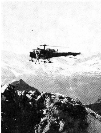
Turbinen-Hubschrauber «Alouette III» im militärischen Hochgebirgseinsatz