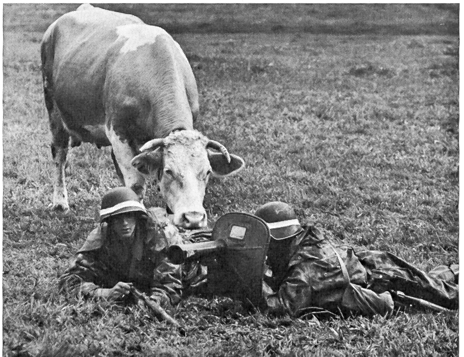
«Der unfreiwillige Humor kommt auch im Gefechte vor!»