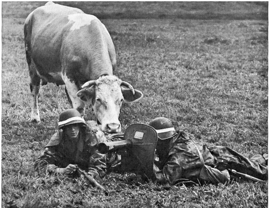
«Der unfreiwillige Humor kommt auch im Gefechte vor!»