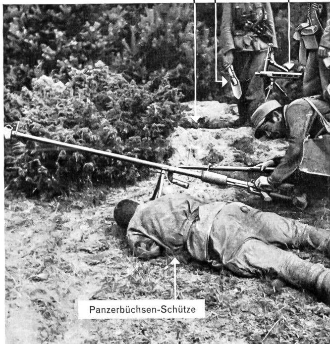
Kdt. Füs.Bat. 33

Mg. für Sturm und Einbruch auf Vorderstütze