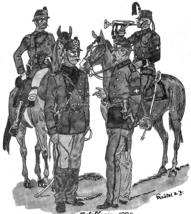
Artillerie 1884 Offizier Fahrer Wachtmeister Trompeter

bildeten und bewaffneten Kompanien. Die Scharfschützen wurden nicht mehr besonders rekrutiert. Bis 1891 behielten sie noch den Repetierstutzer (Mod. Vetterli 1871); von da an erhielten sie auch das gleiche kleinkalibrige Infanteriegewehr. Schließlich erinnerte nur noch der grüne Rock an die versunkene Schützenherrlichkeit.