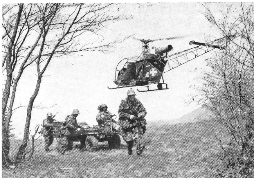
Zusammenarbeit Luft-Boden. Teamwork ist auch im Kriege Voraussetzung für den Erfolg. Helikopter und mot. Truppen in koordiniertem Einsatz.