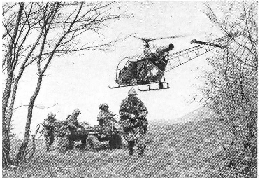
Zusammenarbeit Luft-Boden. Teamwork ist auch im Kriege Voraussetzung für den Erfolg. Helikopter und mot. Truppen in koordiniertem Einsatz.