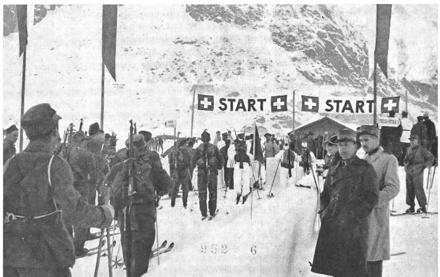
Andermatt, Behörden und Bevölkerung, wie auch die Festungswachtkompanie 17 werden, wie in früheren Jahren, mit ganzem Einsatz dazu beitragen, der eidgenössischen Leistungsprobe unserer Skisoldaten und der Wehrmänner aus neun Nationen den bekannten glanzvollen Rahmen und eine friktionslose Organisation zu bieten.