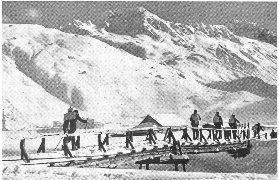
In diesem prachtvollen Gelände des Urserntals, der Wiege des schweizerischen Militärskillaufes, Tausenden unserer Wehrmänner durch Patrouillenkurse, Winter-Gebirgs-wiederholungskurse und freiwillige Ski- und Gebirgskurse bekannt, spielen sich die kommenden Winter-Armeemeisterschaften und die Internationalen Militär-Skimeisterschaften ab.