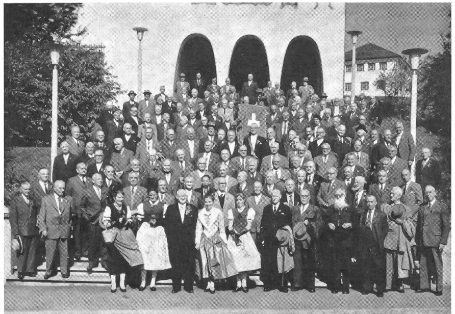
Die Veteranen des Schweizerischen Unteroffiziersverbandes an ihrer Tagung am 2. Oktober 1960 vor dem Bundesbriefarchiv in Schwyz

th. Bern war immer eine Stütze der Wehrbereitschaft, in der alten Eidgenossenschaft und nachher im Bund. Der außerdienstlichen und freiwilligen Tätigkeit verpflichtet, wie sie besonders auch bei den Berner Unteroffizieren gepflegt wird, kam auch aus diesen Reihen vor drei Jahren die Anregung und Initiative zur Gründung der «Kameradschaftlichen Vereinigung der Aktivdienst-Veteranen 1914 bis 1918». Wenn auch einzelne Truppenkörper und Einheiten der Aktivdienstjahre des ersten Weltkrieges zusammengehalten haben, so lichten sich doch ihre Reihen und man spürt das Bedürfnis, Anschluß und Deckung in einem größeren, eidgenössischen Zusammenschluß zu