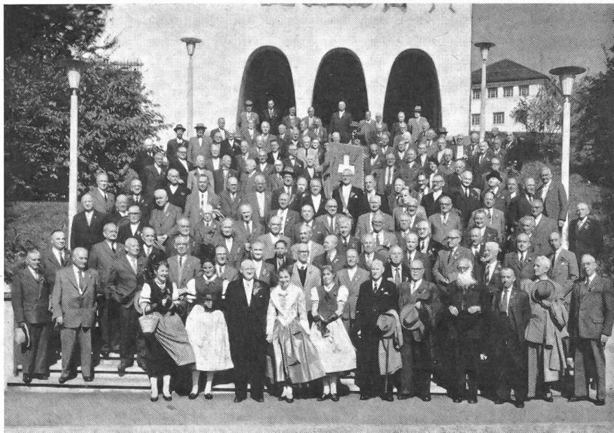
Die Veteranen des Schweizerischen Unteroffiziersverbandes an ihrer Tagung am 2. Oktober 1960 vor dem Bundesbriefarchiv in Schwyz

th. Bern war immer eine Stütze der Wehrebereitschaft, in der alten Eidgenossenschaft und nachher im Bund. Der außerdienstlichen und freiwilligen Tätigkeit verpflichtet, wie sie besonders auch bei den Berner Unteroffizieren gepflegt wird, kam auch aus diesen Reihen vor drei Jahren die Anregung und Initiative zur Gründung der «Kameradschaftlichen Vereinigung der Aktivdienst-Veteranen 1914 bis 1918». Wenn auch einzelne Truppenkörper und Einheiten der Aktivdienstjahre des ersten Weltkrieges zusammengehalten haben, so lichten sich doch ihre Reihen und man spürt das Bedürfnis, Anschluß und Deckung in einem größeren, eidgenössischen Zusammenschluß zu