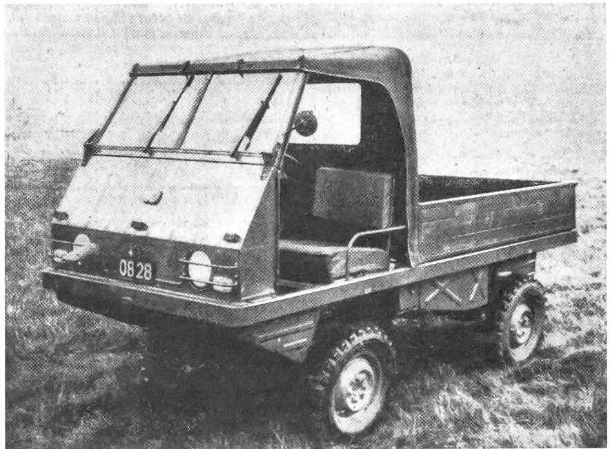
Gegenwärtig werden in unserer Armee zwei neue Gefechtsfeld-Fahrzeuge erprobt. Unser Bild zeigt das Fahrzeug der österreichischen Firmen Steyr-Puch. Es ist ausgerüstet mit einem Zweizylinder-Boxermotor von 22 PS und einem Fünfganggetriebe. Dieses Fahrzeug mit vier Sitzplätzen, wovon zwei versenkt werden können, kann auch für den zivilen Bedarf verwendet werden.